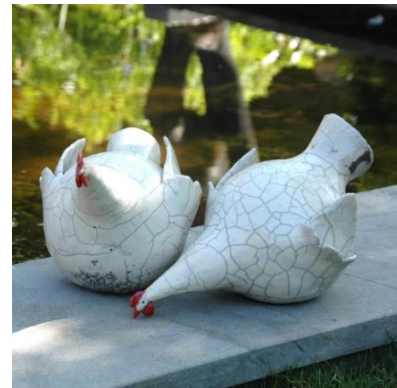
raku gestookte kippen